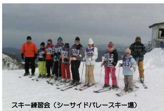
スキー練習会（シーサイドバレースキー場）

さて、インフルエンザが猛威を振るっています。本校にも先週より罹患する子供が出始めました。学校ではマスクの着用に加え、うがいや手洗い、換気などに十分配慮しています。ご家庭におかれましても、十分な睡眠やバランスの取れた食事をとるとともに、うがいや手洗いをしっかり行い、インフルエンザに備えていただきますようお願いいたします。また、降雪・積雪時における登下校の安全についても、引き続きご指導をお願いいたします。